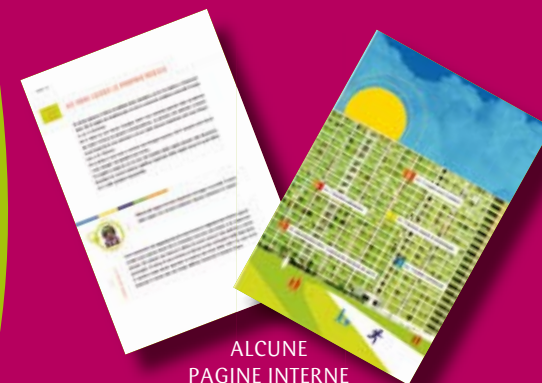
ALCUNE PAGINE INTERNE